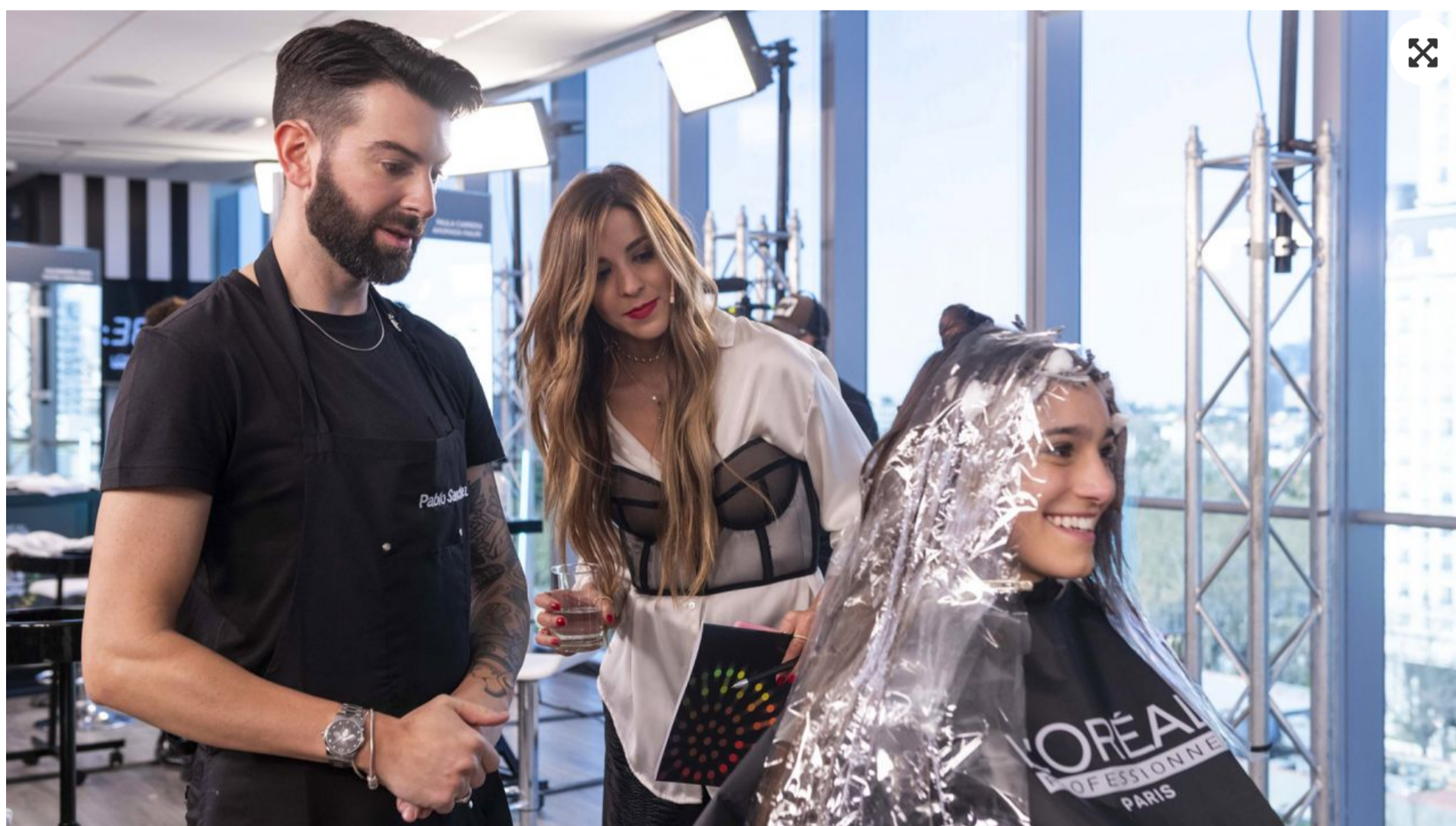
STYLE &amp; COLOUR TROPHY DE L'OREAL PROFESSIONNEL

El certamen de estilo y color más importante del mundo llegó renovado. En esta edición internacional número 64 y la 16 nacional, la propuesta fue crear un look de tapa de una revista para celebrar la belleza del pelo adoptando las últimas tendencias. Las técnicas elegidas por L'Oréal Professionnel para este Style&Colour Trophy fueron French Balayage -degradé natural de raíz a punta- y French Glossing que pone el foco en el brillo del cabello.